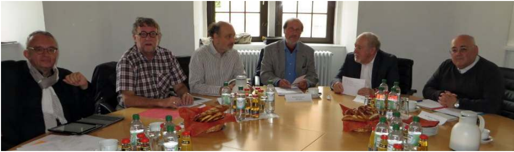
Das Comité trinational in Speyer

http://www.dreilaendermuseum.eu/de/Netzwerke-Geschichtsvereine/Comitee-trinational