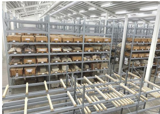
Vue du nouveau centre des collections d'Augusta Raurica.

Le système sophistiqué de climatisation à l'aide de terre glaise pose de nouveaux jalons. Grâce à une couverture photovoltaïque de plus de 1400 modules solaires, le bâtiment est largement autonome sur le plan énergétique. Il est construit sur les fondations d'un ancien quartier de commerçants et d'artisans. Un tiré à part portant le titre Construire sur les ruines est disponible au musée Augusta Raurica , CH-4302 Augst. La fondation Pro Augusta Raurica qui compte de nombreux membres, a également soutenu le projet. (dw)