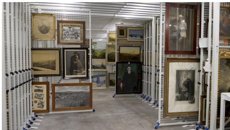
Das neue Depot: Eingang und Gemäldesammlung